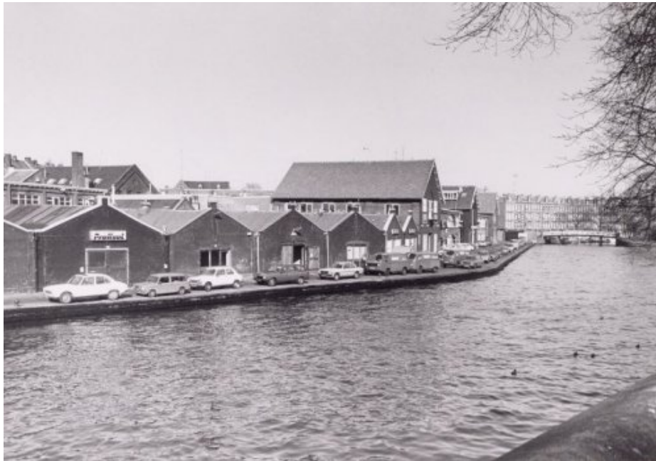
Kostverlorenkade (1983, I. Roël)

Aanlegplaats van kolenschepen. Toen er in de Hongerwinter nauwelijks nog schepen kwamen, probeerde men met schepnetten kolen uit het water te halen.