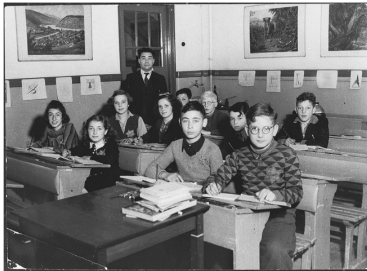
De Joodse School in de Cliffordstraat

Stadsdorp Westerpark had graag op 4 mei een Herdenkingswandeling willen houden door de buurt. De wandeling zou niet al te lang worden en om 19.30 uur aansluiten bij de officiële herdenkingsstoet van het Marnixplein naar de Noorderkerk. Deze wandeling kan helaas nu opnieuw niet doorgaan.