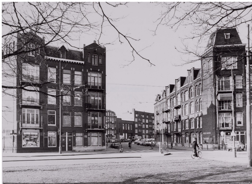
Zicht op de Kostverlorenstraat met middenin het Herba bedrijfsgebouw (1940)

Dit bedrijfsgebouw is niet al te lang geleden diepgaand gerenoveerd. Hier was in de oorlog schoenfabriek Herba gevestigd, die in opdracht van de Duitsers honderd leren schorten heeft vermaakt tot schoenen. De schorten waren in beslag genomen bij de Vrijmetselaarsloge in de Vondelstraat.